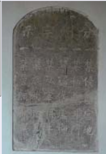
■写真5—維持管理手法を後世に説いた石板と銘文の和訳

一、政府の管理する土地に入ってはならない 一、勝手に水門を作ってはならない 一、堤防の葦と柳を切ってはならない 一、働く牛を殺してはならない 一、堤防の上で猪と羊を飼ってはならない 一、網で魚を採ってはならない