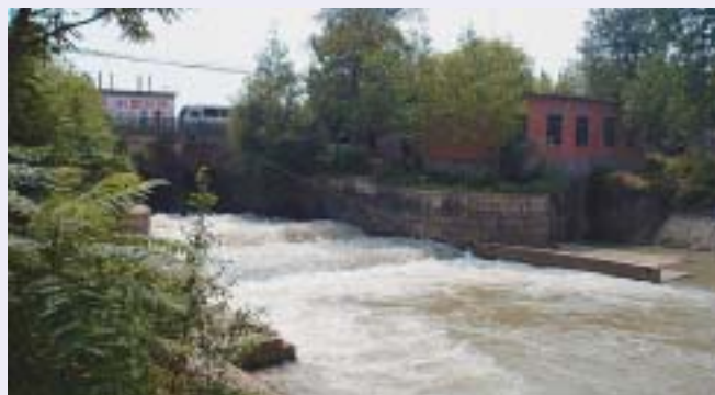
■写真6—大型配水門“才店令制門”前方に発電施設が見える

日本最古のダム式ため池として有名な大阪府狭山市の“狭山池”は飛鳥時代(7世紀前半)に造られたとされる。