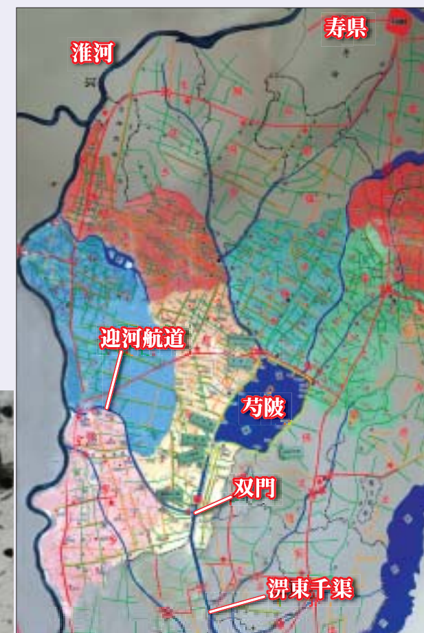
■図1—芍陂の全容 芍陂を中心に水路が周囲に広がっている

この様な近代と変わらない施設がおおよそ2500年前に既に考案され実用化されていたことに驚嘆し、歴史の深さに感服する。これらは自然を知り水の特性を解し、それを利することを旨とした古代中国の優れた設計思想