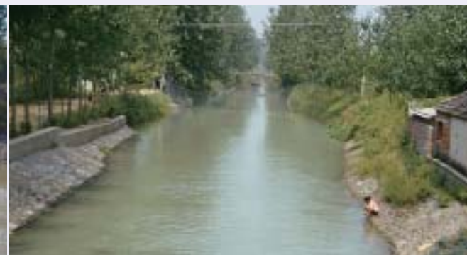
■写真7—用水が沿々と流れる“團結門支渠”

唐代に入ると芍陂で潤った周囲の豪族は、“孫叔敖”の教えを忘れ湖沼を埋め立て私有の耕作地とし、更には、周囲の自分の土地へも水を引くため勝手に水門を設け始めた。その総数は28門とも30門ともいわれている。この結果湖沼は次第に消滅し、周囲の人々はその報いとして、巨大な水源・水防施設と貴重な財源であっ