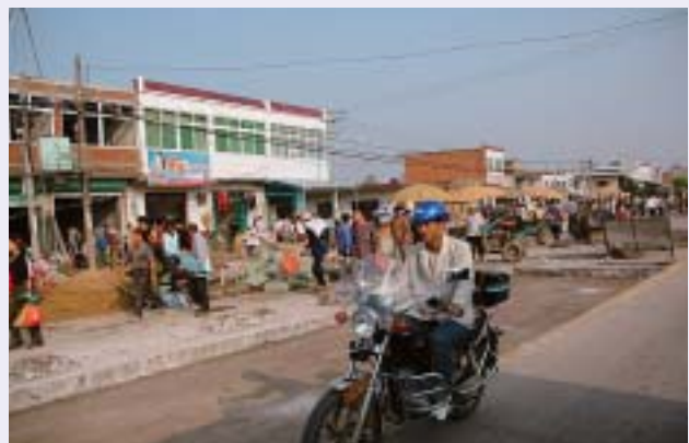
■写真10—湖水の豊かさが支える活気ある水辺の街並

同施設の現在の常時配水能力は100m 3 /sec。また緊急時の排水能力は200m 3 /secである。1991年の洪水時に発生した湖水への最大流入量は400m 3 /secであったが、芍陂が有する膨大な貯水能力で対応し、一部は淮河へ放流することでその時は事なきを得たそうである。ただしこれ以上の流入量があり堤防決壊の恐れがあると判断された場合には、太古より人々がそうしたように、今も