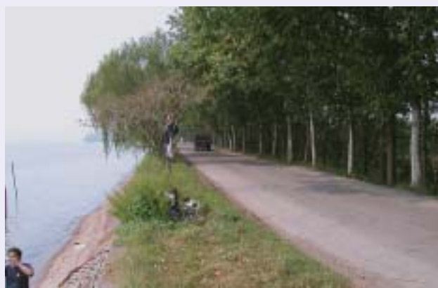
■写真1—堤防天端の道路を走るトラック 堤防法面保護のための樹木が配されている

建設は春秋時代のBC598～BC591年とされ、後に続く“漳水渠”“都江堰”“鄭国渠”などの著名な水利事業の原点と云われている。その姿は誰もが知る中国の戦乱を綴った大叙事詩“三国志”にも登場するなど、つとに