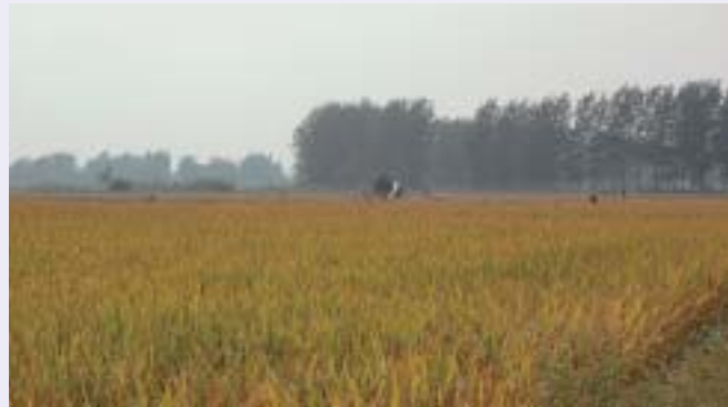
■写真8—周囲の広大な水田に稲穂が実る