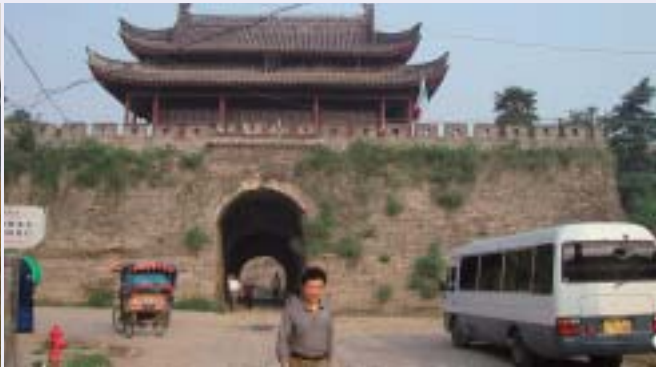
■写真9—今も当時の姿を残す寿春(現在の寿县)の城壁

一部の堤防を爆破決壊させ甚大な被害を食い止める方策を採ることが決められているという。