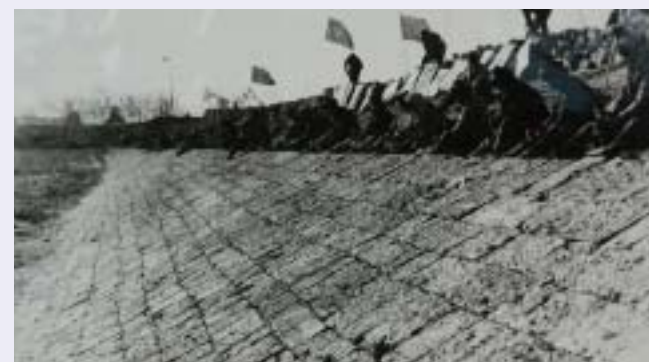
■写真4—1972年当時の堤防基礎部の修復作業

建設当時の堤防長は150kmもあり、用水路は堤防から放射状に張り巡らされた。湖底を灌漑地の標高より高く設定することで、周囲の灌漑面積660万haの水田に