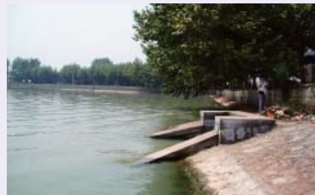
■写真2、3—1972年の修復で嵩上げされた堤防と取水口