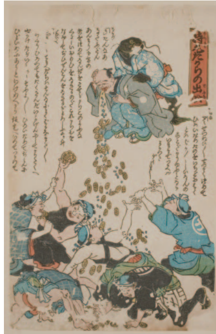
図2 鯰絵『持丸たからの出船』

また、現在の義援金に相当する施行 せぎょう と呼ばれる民間の相互扶助が広く震災社会を覆い、震災後の生活困難者に対して直接救済の手が差し伸べられました。こうした施行町人は255人、その施行額は15,000両に及んでいます。今の貨幣価値に換算すると、1両20万円としても30億円となります。多額の金が民間の拠出金として放出されたわけですから、庶民にとっては、震災を受けたとはいえ、却って日頃の生活困窮が一時的に解消される側面もありました。また、大工、左官、鳶などの職人は家屋修復の人手不足で引く手数多となり、賃金が高騰し、日頃は職人に高値の花の吉原も仮宅 かりたく (仮営業所)営業となり、金回りのよくなった職人が仮宅通いをしたため、吉原の客層が一変したといえます。仮宅でひやかしをする大工、左官、鳶などの職人を揶揄した地震鯰絵が出回ったのも決して絵空事ではなかったのです。