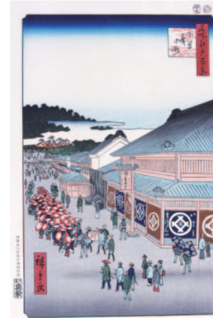
図5 『下谷広小路』(歌川広重『名所江戸百景』より)

歌川広重は火消同心役を嘉永2(1849)年に退職しましたが、勤務した八代洲河岸の火消屋敷は地震後の火災で焼失しています。近くの広重自身の住居は残りましたが、家の辺りも損壊は免れなかったと推定されます。安政4年7月の改印のある『市中繁栄七夕祭』の絵は、この火消屋敷が、安政3年3月には早く