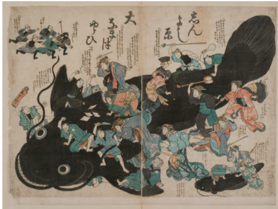
図4 鯰絵『しんよし原大なまづゆらひ』