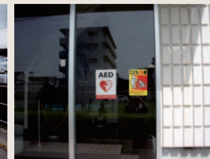
こども110番 協力会社ステッカー(本社玄関)