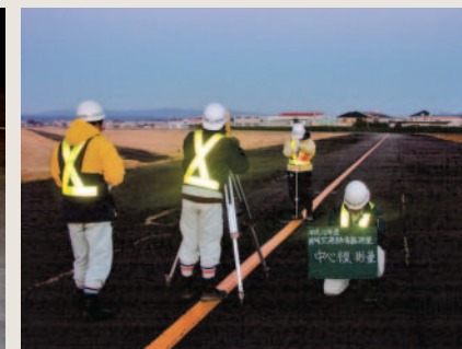
宮崎空港内中心線測量