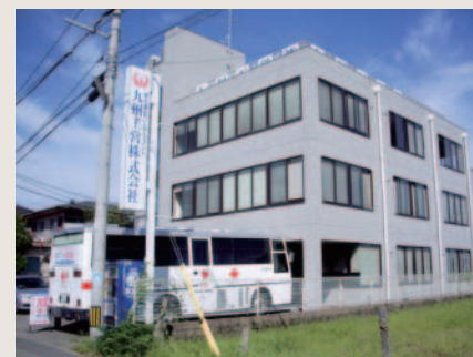
献血車両と技術本部