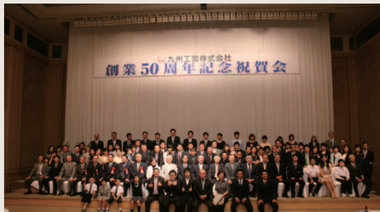
平成24年6月9日 50周年記念祝賀会を開催