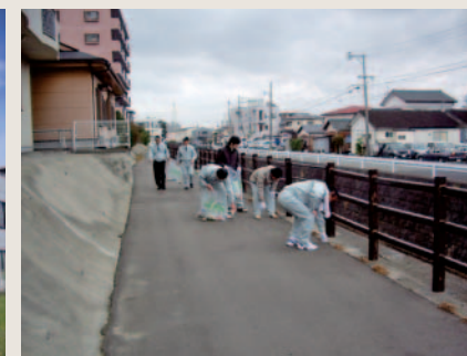
月初めの清掃活動(全社員参加)