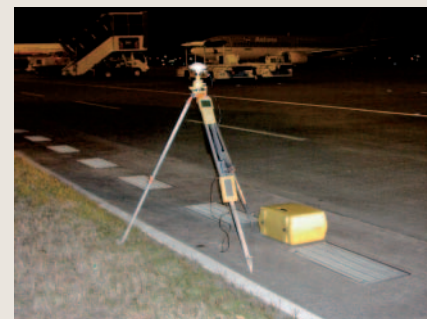
宮崎空港内基準点測量