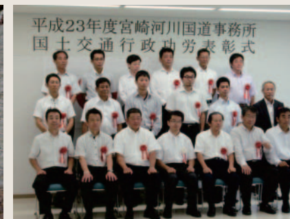
平成23年度 業務功績表彰