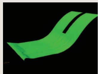
ダム流路工の3次元解析と詳細点検補修設計