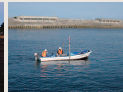
宮崎港内深淺測量