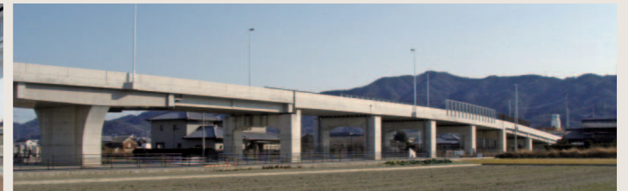
一般県道 宮川内牛島停車場線 牛島跨線橋