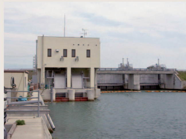
刈屋川排水機場・水門