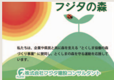
とくしま協働の森づくり事業