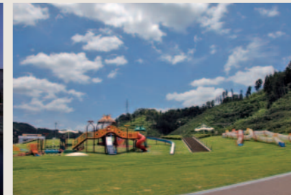
南部健康運動公園