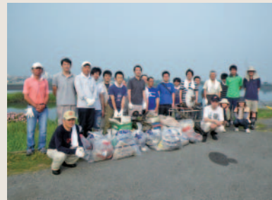
ボランティアサポート活動状況(河川・道路)