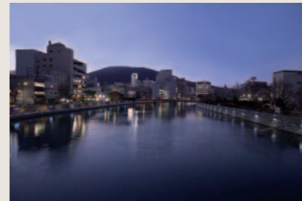
新町川河畔ひかりプロムナード