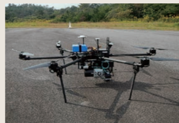
レーザーキャナー搭載UAV

上田市主催の「上田古戦場マラソン」では第1回より携わり今年で30回目になります。春の「千本桜まつり」や秋の「真田幸村ロマンウォーク」では、10種の野菜を