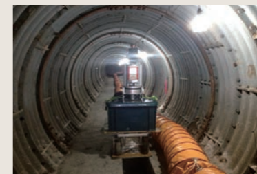
長野市 排水トンネル3D計測