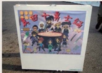
真田十勇士鍋看板