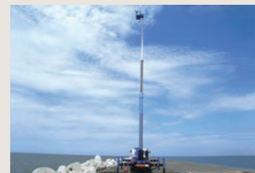
新潟県新潟港 防波堤3D計測