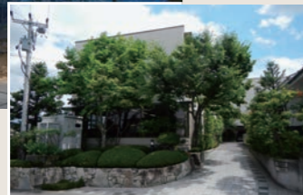
本社社屋アプローチ部