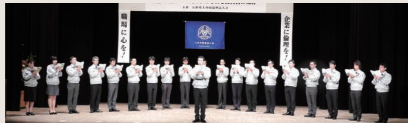
倫理経営講演会での活力朝礼の実演