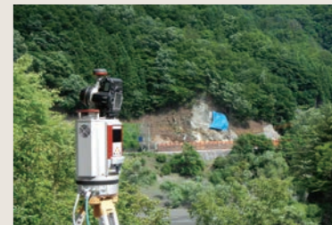
長野県大鹿村 斜面崩壊3D計測