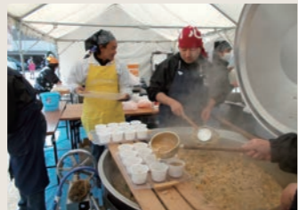
十勇士鍋のふるまい