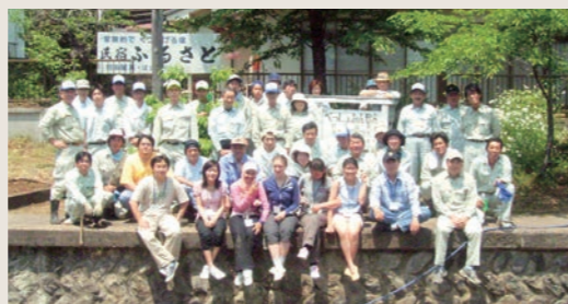
別所温泉駅ホームの花壇整備