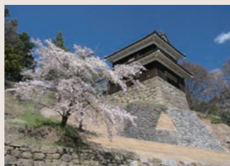
春の桜と上田城西櫓