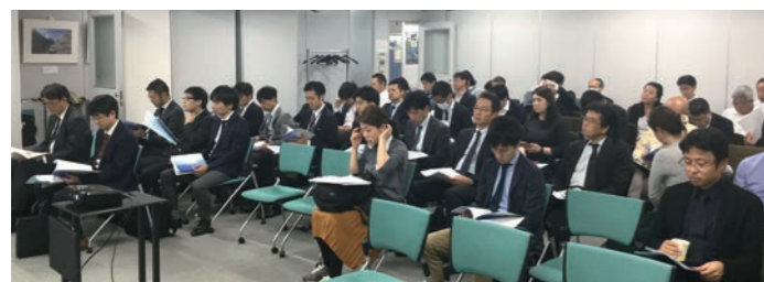
写真1 セミナー受講状況