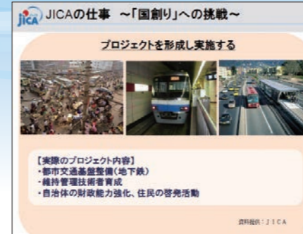
図2 JICA 小森氏による講演スライド例