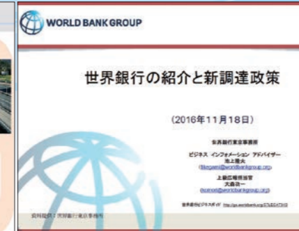
図3 世銀 池上氏・大森氏による講演スライド例