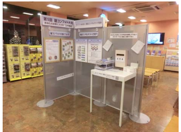
無料休憩所内の展示会場の様子