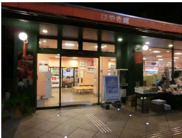
無料休憩施設入口に設置した立て看板