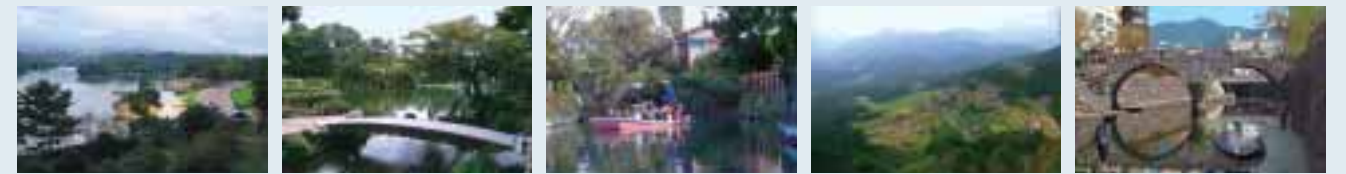
①満濃池 ②兼六園 ③柳川 ④丸山千枚田 ⑤眼鏡橋