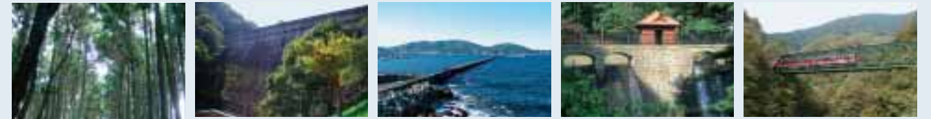
⑦布引ダム ⑧小樽港の防波堤 ⑨大湊第一水源地堰堤 ⑩箱根登山鉄道