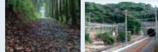
⑥箱根旧街道石畳 ⑪関門鉄道トンネル

参考資料 : (無印) [Consultant] (社) 建設コンサルタンツ協会 既掲載 (★) [Consultant] 238 (H20.1.1) 号 (社) 建設コンサルタンツ協会 (▲) [Consultant] 239 (H20.4.1) 号 掲載予定 (■) [Consultant] 240 (H20.7.1) 号 掲載予定 (◆) [Consultant] 241 (H20.10.1) 号 掲載予定 歴史監修 : 金本浩二 (日本大学第三高等学校 社会科講師)