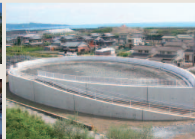
建設中の津波避難広場