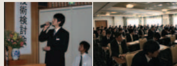
恒例となっている社内技術検討会