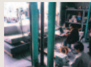
プレガードの静的載荷試験