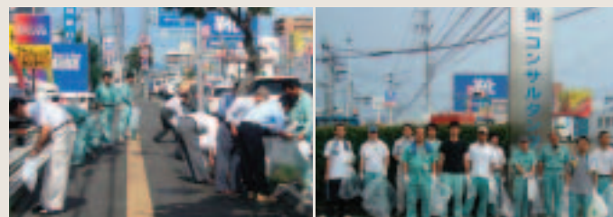
「88クリーンウォーク」で高須地区を担当した社員