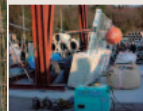
落石防護柵への重錘衝突実験