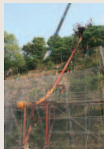
ロングスパンへの重錘衝突実験