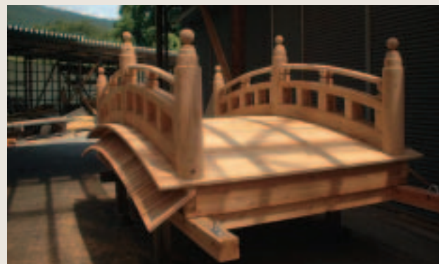
地方車を飾った播磨屋橋の模型