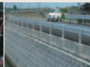
施工されたプレガード