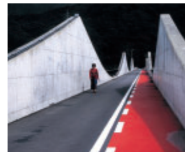
「水路橋」 静岡県 滝井 厚