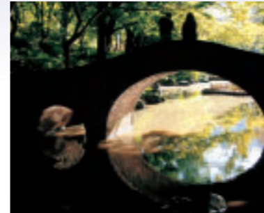
「静な公園」 神奈川県 井上 惣次郎