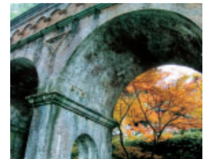
「土木と自然の調和の美しさ」 —琵琶湖疏水・水路閣— 埼玉県 木戸 エバ