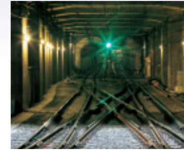
「終着駅より」 東京都 弓倉 純一