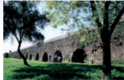
「古代ローマの水道橋」 東京都 山田 耕治