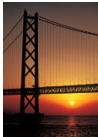
「暮れる大橋」 兵庫県 渡邊 俊幸