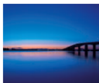
「琵琶湖大橋の夜明け」 大阪府 楠本 博