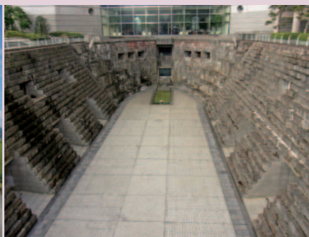
② 旧横浜船渠第2号ドック