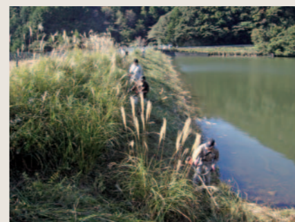
農地・水・環境保全向上活動(草刈り)