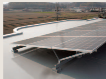
社屋屋上ソーラーパネル設置