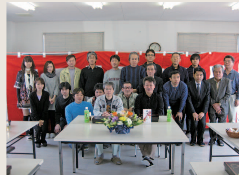
技術士合格祝の集い