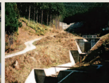
砂防堰堤(三重県松阪市)