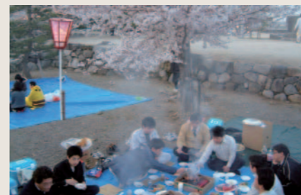
お花見の会(松坂城跡にて)