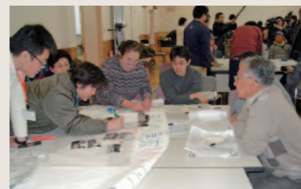
津波防災マップ作成ワークショップ