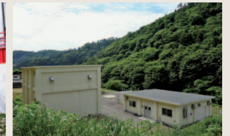
亀田地区簡易水道施設統合設計