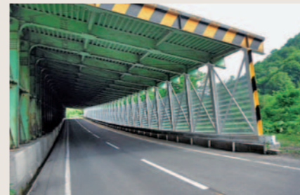
国道105号赤倉1号スノーシェッド補修設計