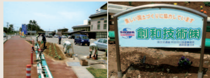
国道7号線道路美化活動(右写真同じ)