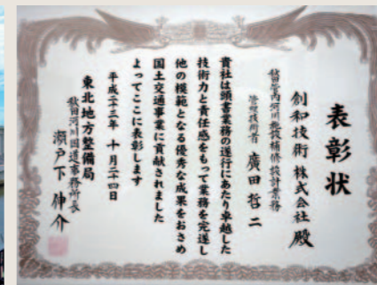
秋田管内河川施設補修設計表彰状