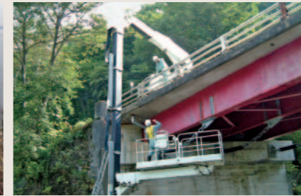
仙北市赤倉橋点検作業