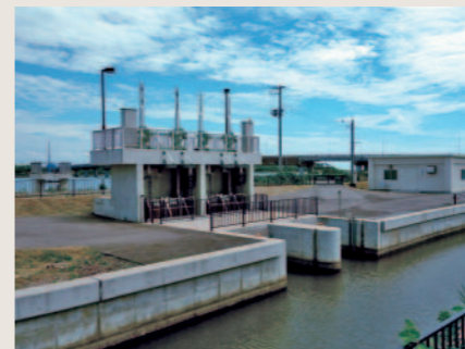
男鹿市船越排水機場統廃合設計