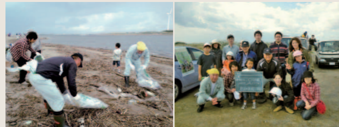
雄物川河川敷クリーンアップ活動(右写真同じ)