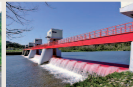
大館市立花頭首工補修設計