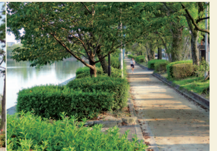
写真7 佐賀城の濠沿いのジョギングコース