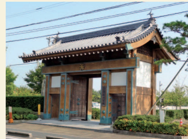
写真6 「鯨の門」を模した赤松小学校の校門