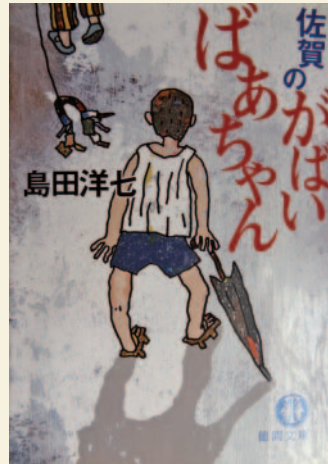
写真1 文庫本『佐賀のがばいばあちゃん』の表紙

小説の舞台は、小学2年であった1958(昭和33)年秋から中学卒業までの8年間を祖母と過ごした、母親の故郷・佐賀である。この1900(明治33)年生まれ祖母が、厳しい終戦期に佐賀大学やその附属小・中学校の掃除婦をしながら五女二男計七人の子供を育てた、小説のタイトルになった「がばい(すごい)ばあちゃん」なのである。