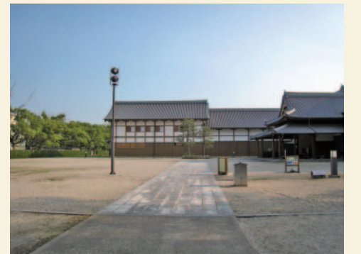
写真5 旧赤松小学校のグラウンド