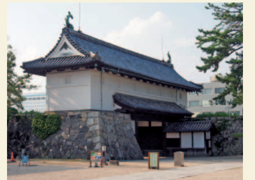
写真4 旧赤松小学校の正門だった「鯨の門」