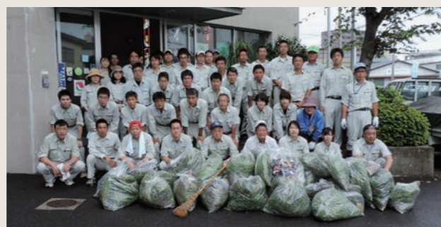
道路ボランティア清掃