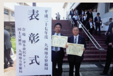
国土交通省九州地方整備局 局長表彰（業務・技術者）左：管理技術者 右：社長

また夏休み期間を利用して子供の職場参観を実施しています。子供たちに普段、見ることが出来ない職場の見学や建設コンサルタントの仕事の内容を紹介することで、私たちの仕事に興味や関心を持ち、将来の担い手となることを期待しています。その他名刺交換、社内スタンプラリー、測量機器の使用体験や最後には子供たちに日頃の感謝の気持ちを込めて、表彰状と記念