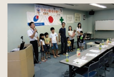
2015 こどもの職場参観日②