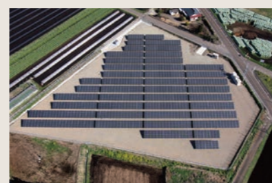
大福太陽光発電所（宮崎県）