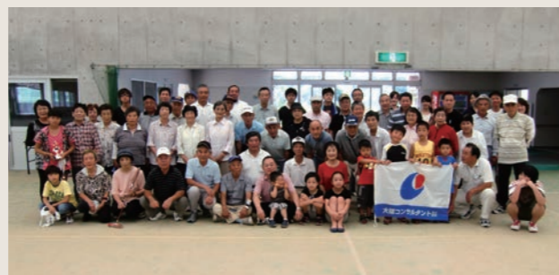
大福杯ゲートボール大会