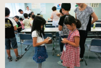
2015 こどもの職場参観日①