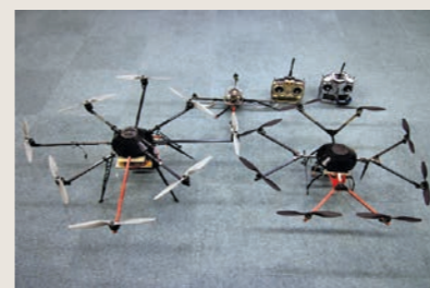
当社のマルチコプター