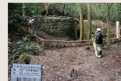
世界文化遺産 寺山炭窯跡 3Dレーザー スキャナーにて3次元計測