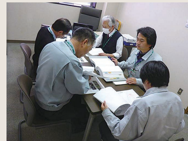
デザインレビューの状況