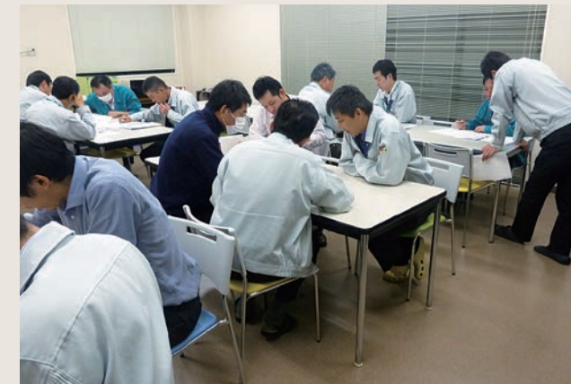
資格取得に向けた社内勉強会