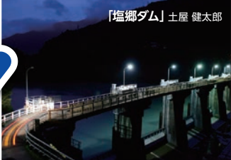
「塩郷ダム」 土屋 健太郎