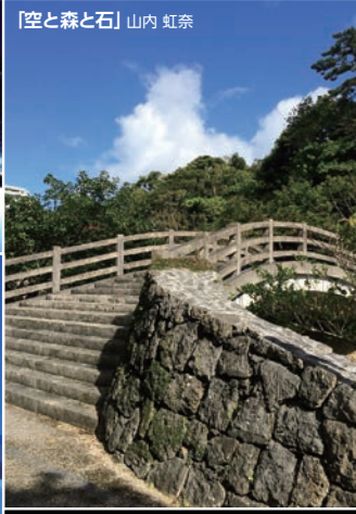
「空と森と石」 山内 虹奈