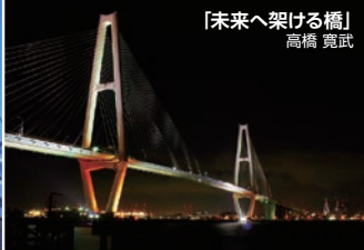
「未来へ架ける橋」 高橋 寛武