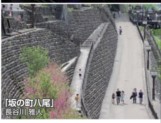
「坂の町八尾」 長谷川 雅人