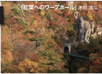
「紅葉へのワープホール」 木村 渡斗