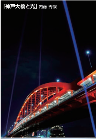
「神戸大橋と光」 内藤 秀哉