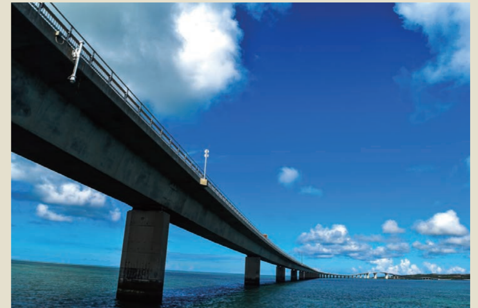
「空と海と栗間大橋」