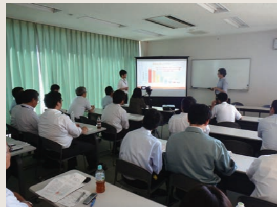
土木・IT技術者合同の社内技術発表会