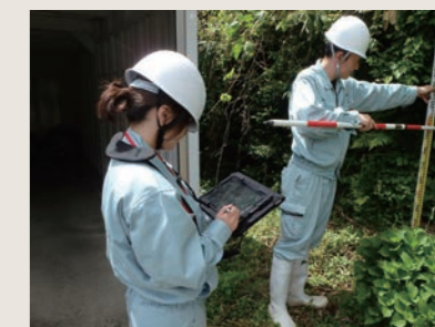
タブレット調査支援システム「SABLET」