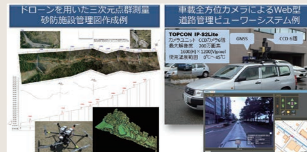
ICT機器を活用した計測サービス