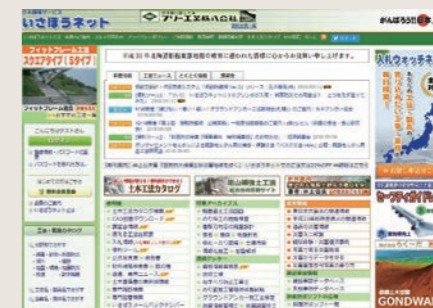
土木情報サービス「いさぼうネット」