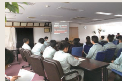
技術調査研究発表会