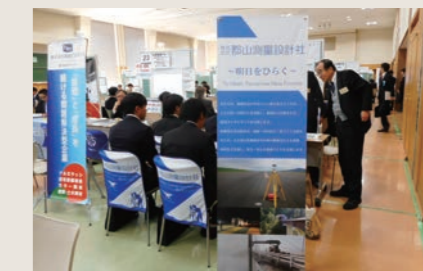
地元大学生への企業説明会