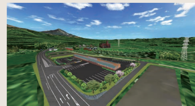
VR道の駅整備景観シミュレーション