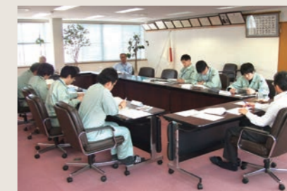
新人社員等若年者研修