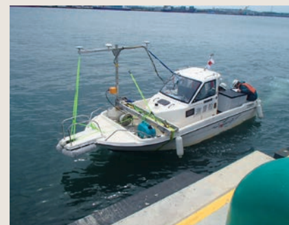
マルチナロー深浅測量