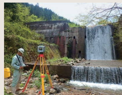
地上レーザー測量