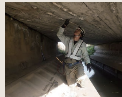
コンクリート劣化診断