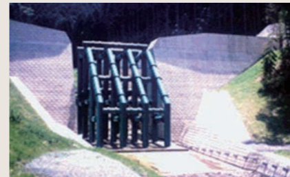
砂防施設: 流木捕捉工