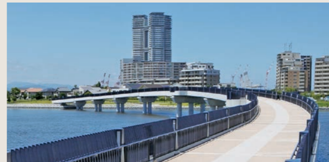
第26回福岡市都市景観賞・市民賞 あいたか橋 (福岡市提供)

自然災害や地球温暖化等対応した国土強靱化、建設分野におけるSDGs、脱炭素社会、ストックマネジメント、ため池防災、ハザードマップ作成等の業務に円滑に