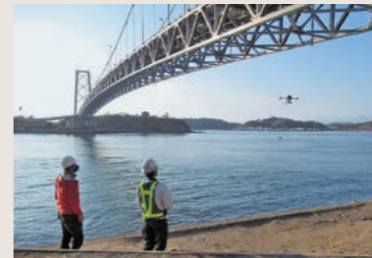
特殊橋梁点検: ドローン活用