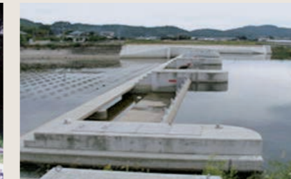
河川構造物: 鋼製転倒ゲート