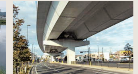
構造物: 福岡都市高速

対応できる技術者の体制づくりに努めていきます。また、新型コロナウイルス感染症対策としてテレワークなどの職場環境づくりをさらに推進していきます。