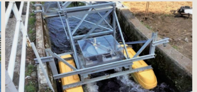
低炭素杯2018 企業部門・優秀賞 低落差小水力発電