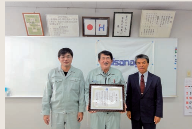
鹿児島県南薩地域振興局農林水産部優良工事等表彰