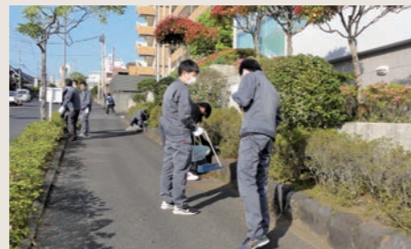
地域ボランティア清掃活動