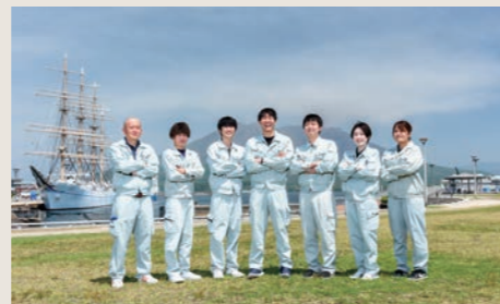
桜島を背に若手技術者達