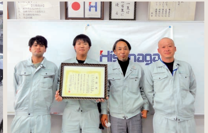
国土交通省川内河川事務所長表彰