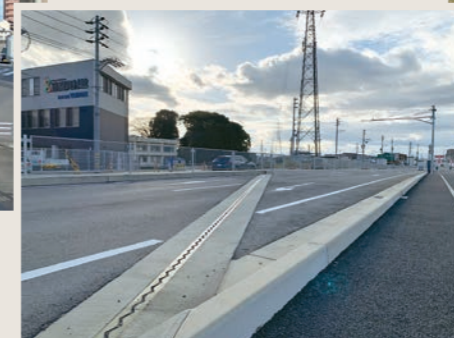
国道バイパス拡幅整備