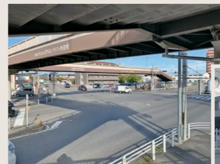
都市計画道路歩道橋新設整備