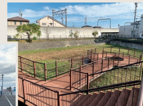
調整池内親水デッキ新設整備