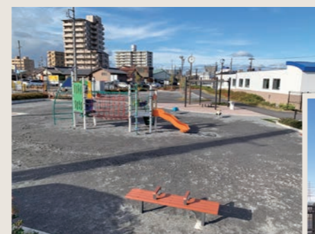
駅横公園新設整備