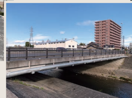
都市計画道路橋梁新設整備