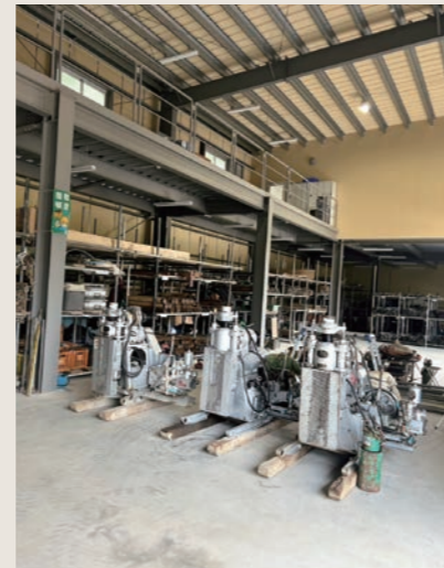
自社ボーリングマシン