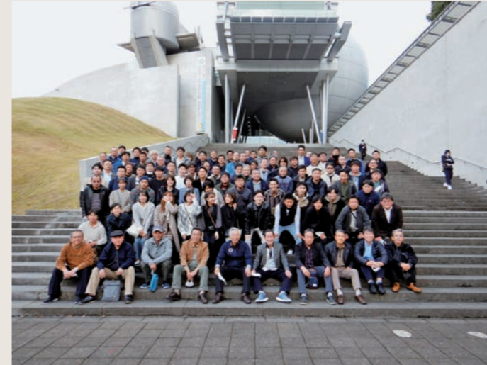
社員旅行 (2021年 佐賀)