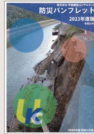
防災パンフレット2023