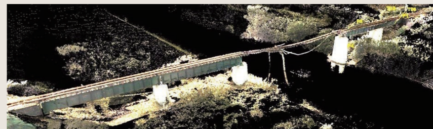
鉄道橋被災状況(点群データ)