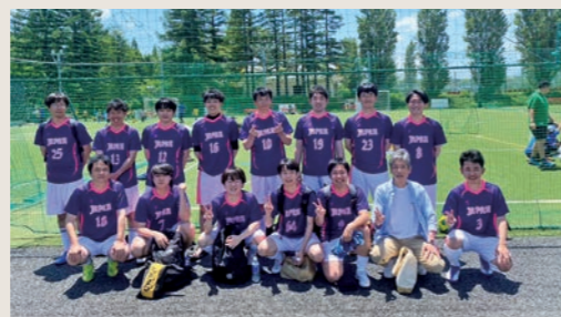
フットサルサークル