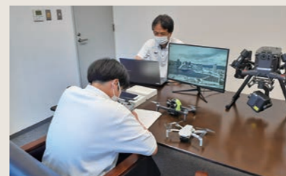
高校生インターンシップ