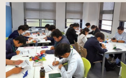
若手フォローアップ研修