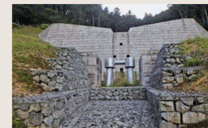
杉之内中谷川砂防堰堤