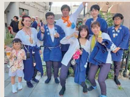
旭川夏まつり大雪連合神輿への参加