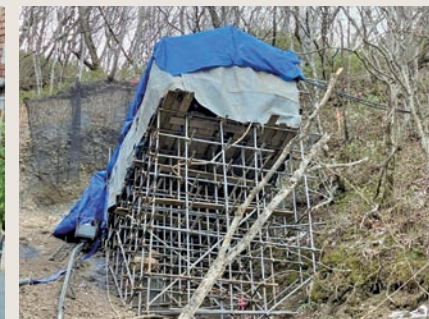
急斜面での作業風景