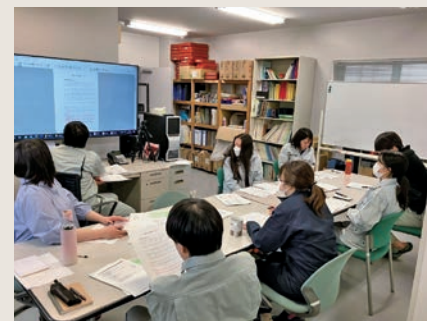
若手による社内勉強会