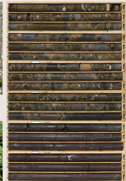
高品質コアの採取