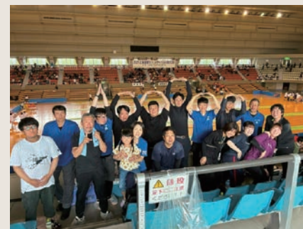
北海道綱引フェスティバルin旭川への参加