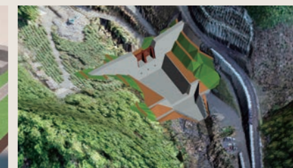
3次元設計 (砂防堰堤設計)