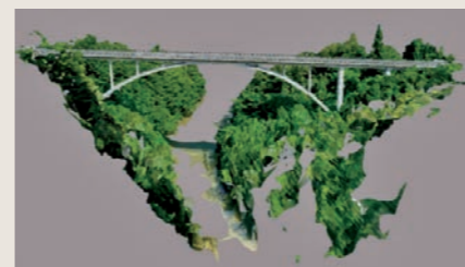
3次元モデル (橋梁点検)