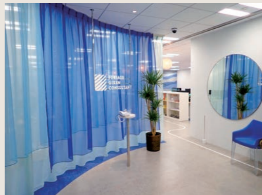
本社内観 (エントランス)