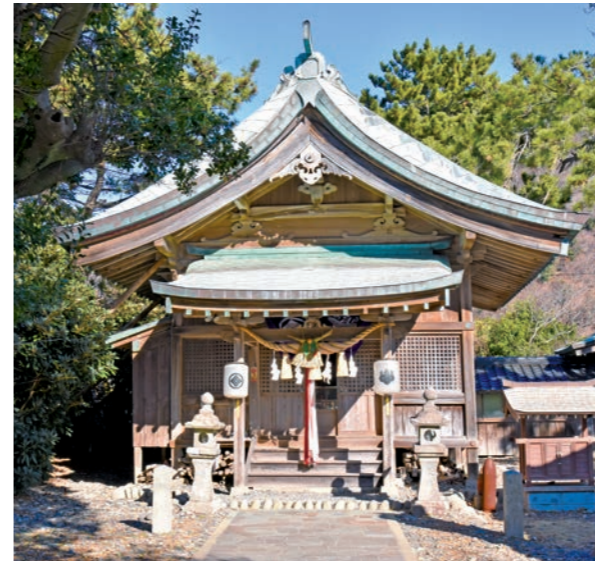
写真7 小茂田浜神社