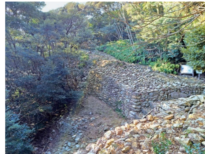
写真2 金田城跡 二ノ城戸

『日本書紀』の天智天皇3(664)年11月条によると、「対馬島・壱岐島・筑紫国（現福岡県）に防人と烽を置いた」との記述がある。防人とは辺境防衛のために諸国から動員された兵士であり、大宰府の防人司が統括していた。また、烽とは敵襲を知らせる警報施設であり、昼は煙を上げ、夜は火を焚くことで合図とした。防衛にあたる人員と緊急時の連絡手段を整えた後、天智天皇6(667)年には大和国（現奈良県）に高安城、讃岐国（現香川県）に屋嶋