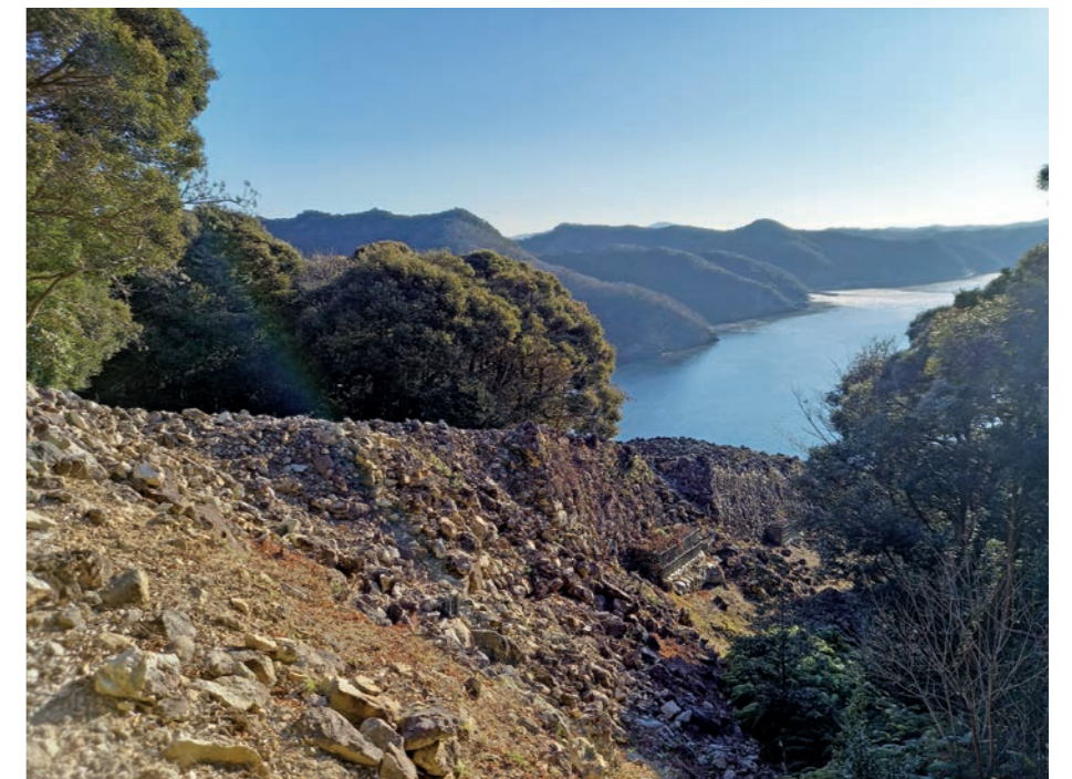
写真4 金田城跡 東南角石塁

城、対馬国に金田城が築かれた。現在も浅茅湾南岸に位置する城山に金田城跡が残る。北西面は傾斜の厳しい断崖だが、東南面は傾斜も緩く、3つの谷間に城戸と呼ばれる城門跡がある。また、城山の頂上から尾根に沿って石英斑岩を積み上げた石塁が走り、総延長にして約2.6kmに及ぶ。同時期に筑紫国や長門国（現山口県）に築かれた山城と同じく金田城も朝鮮式山城とされており、昭和57(1982)年には特別史跡に指定された。