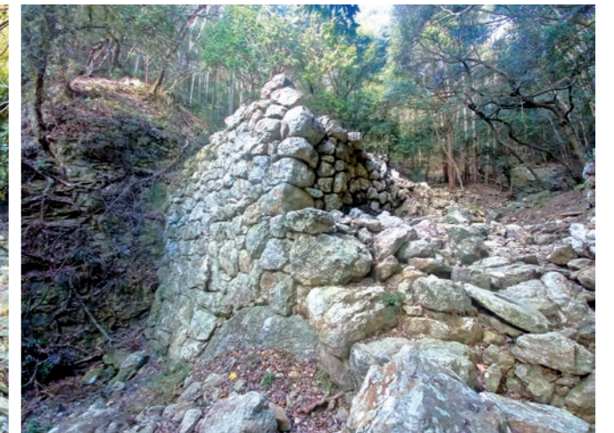
写真3 金田城跡 三ノ城戸

城、対馬国に金田城が築かれた。現在も浅茅湾南岸に位置する城山に金田城跡が残る。北西面は傾斜の厳しい断崖だが、東南面は傾斜も緩く、3つの谷間に城戸と呼ばれる城門跡がある。また、城山の頂上から尾根に沿って石英斑岩を積み上げた石塁が走り、総延長にして約2.6kmに及ぶ。同時期に筑紫国や長門国（現山口県）に築かれた山城と同じく金田城も朝鮮式山城とされており、昭和57(1982)年には特別史跡に指定された。