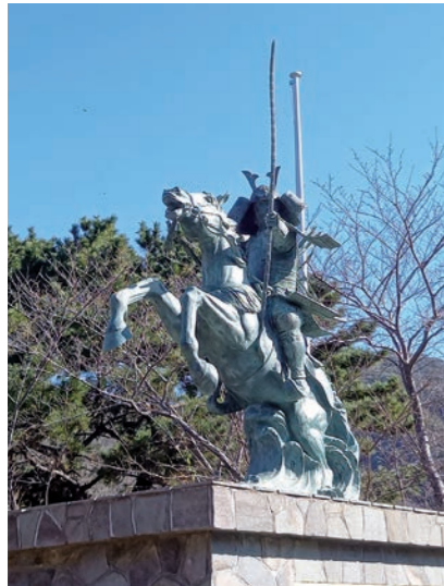
写真5 宗資国像(現対馬市厳原町小茂田浜神社)