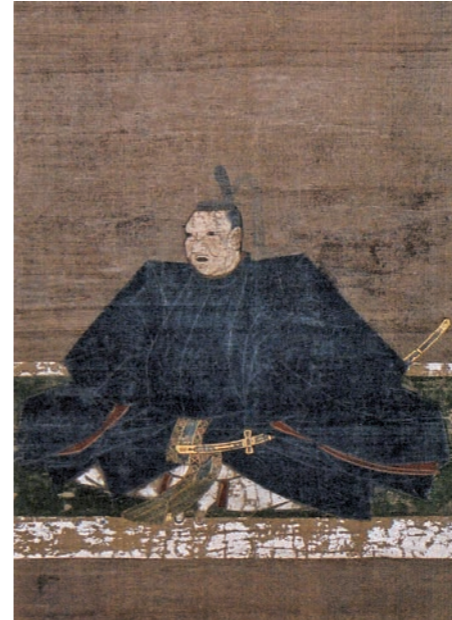
写真4 宗義智公画像

秀吉の後に統一政権を率いた徳川家康は国交を回復すべく、1599年、宗義智に朝鮮との和議交渉を命じた。朝鮮側は国交回復の条件の一つとして、家康から国書を送ることを要求した。家康から国書を送ることは、日本が頭を下げ、和を請うこととなる。義智は、家康からの国書を偽造するという荒技を用いて国交を回復させた。その後、朝鮮から派遣された外交使節が「朝鮮通信使」である。朝鮮通信使は江戸時代に12回日本を訪れるが、1～3回までは「回