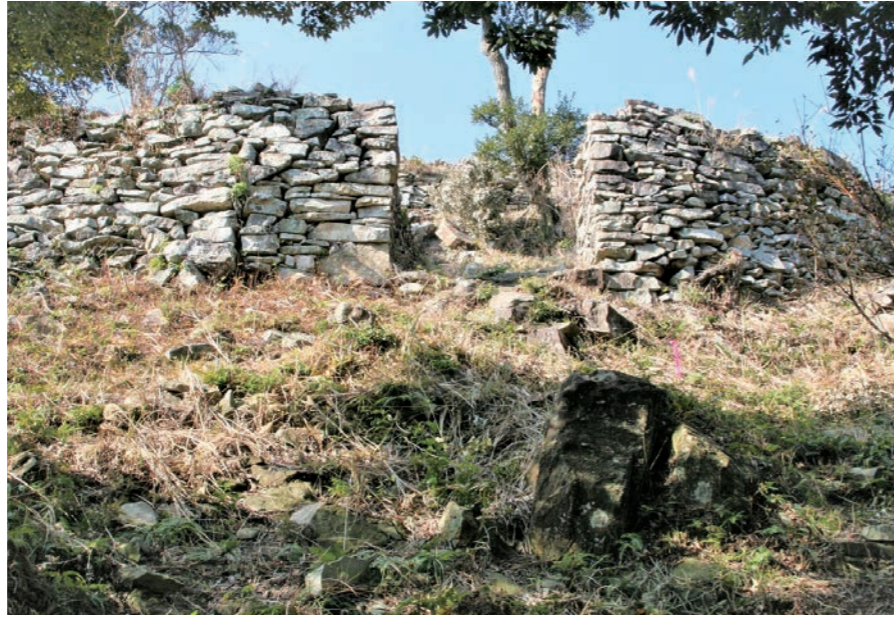
写真3 清水山城 一の丸

朝鮮使節派遣を実現させたが、秀吉はそれを朝鮮の服属と見なし、明までの道案内を要求した。朝鮮側は秀吉の要求を拒絶する。