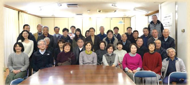
▲ 第 8 回「私のコダワリ」トークは、広々とした「ながたに振興協議会」会議室で開催。（2/2 参加者集合写真）