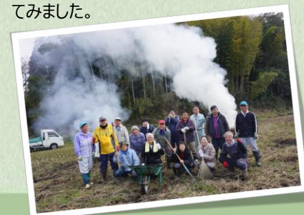
お礼の気持ちを込めて、「みんなの田んぼ」を整備（2/3）