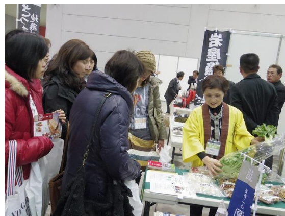
各団体の皆さんのしっかりとした呼びかけに多くのバイヤーさんたちも反応してもらえました（上下写真）