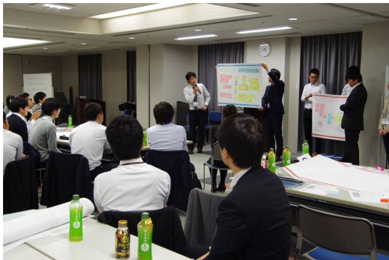
【中国支部交流会 ワールドカフェの様子（平成29年10月）】